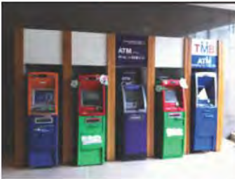
ตู้ฝากถอนเงินสด