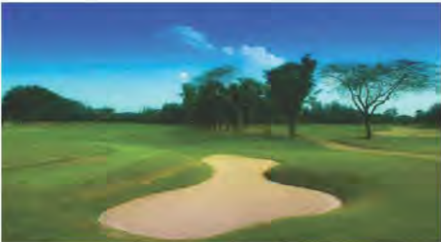
สนามกอล์ฟ จัดเป็นธุรกิจการกีฬา จึงได้รับการลดภาษี

1.4 ลดภาษีร้อยละ 90 ของจำนวนภาษีที่จะต้องเสียของทรัพย์สินที่ใช้เป็นสถานที่เล่นกีฬา สวนสัตว์ สวนสนุก หรือที่จอดรถสาธารณะ