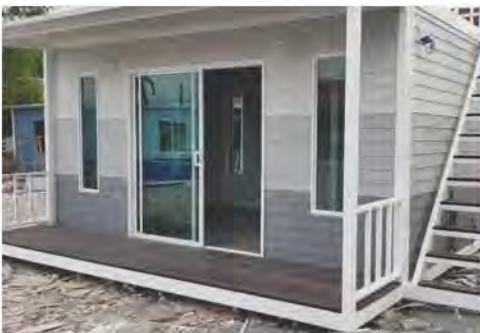
บ้านประกอบเสร็จ