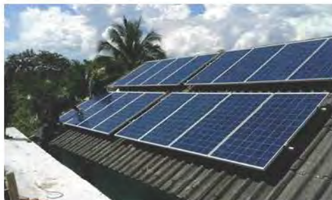
แผงโซลาเซลล์