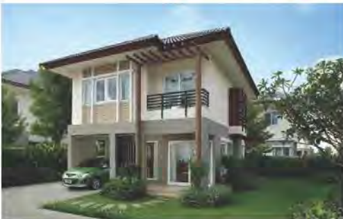
บ้านเดี่ยว

ตัวอย่างสิ่งปลูกสร้างที่อยู่ในข่ายต้องเสียภาษี