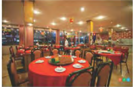
ภัตตาคาร