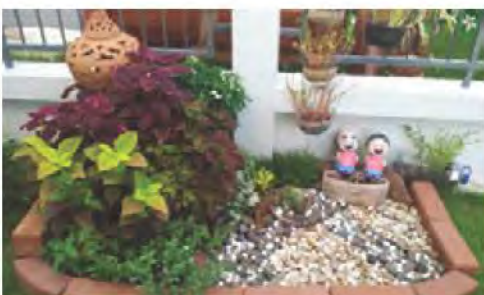
สวนหย่อม