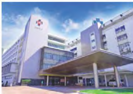
สถานพยาบาล