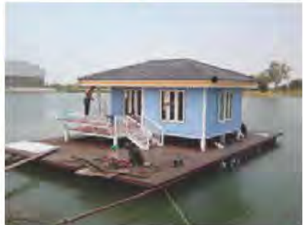
บ้านเรือนแพ