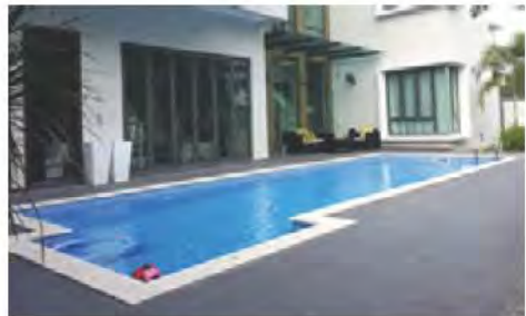
สระว่ายน้ำ