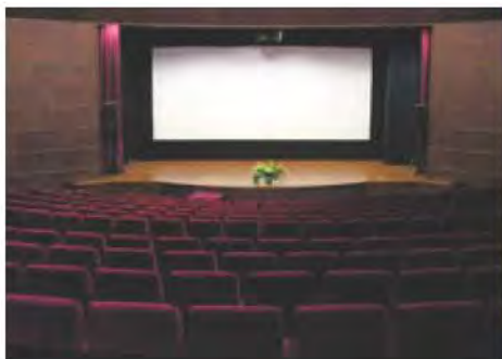
โรงมหรสพ