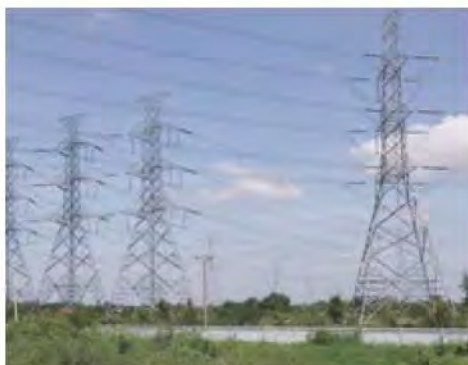
เสาไฟฟ้า