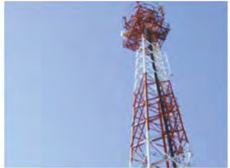
เสาส่งสัญญาณอินเทอร์เน็ต