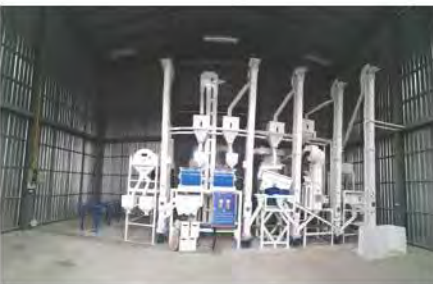
โรงสีข้าว