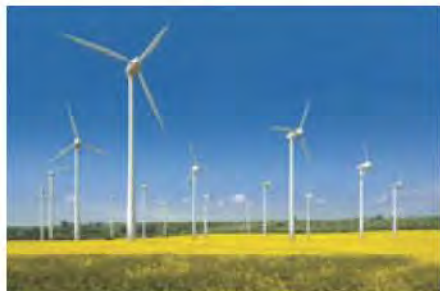
กังหันลม

ตัวอย่างสิ่งปลูกสร้างที่อยู่ในข่ายได้รับการยกเว้นภาษี