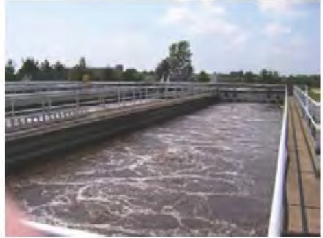
บ่อบำบัดน้ำเสีย