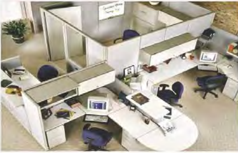
สำนักงาน