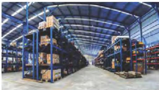
คลังสินค้า