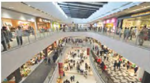
ห้างสรรพสินค้า