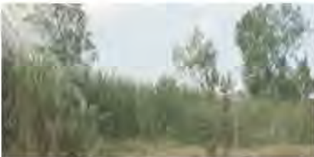
ที่ดินรกร้างไม่ได้ใช้ประโยชน์

(2) ที่ดินที่ไม่เป็นกรรมสิทธิ์ของบุคคลธรรมดาหรือนิติบุคคล แต่อยู่ในความครอบครองของบุคคลธรรมดาหรือนิติบุคคล เช่น สปก. 4, ก.ส.น., ส.ค.1, นค.1, นค.3 ส.ท.ก.1 ก, ส.ท.ก.2 ก, นส.2 (ใบจอง) และที่ดินอันเป็นทรัพย์สินของรัฐซึ่งมีการเข้าไปครอบครองหรือทำประโยชน์ ฯลฯ เป็นต้น