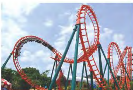
เครื่องเล่นในสวนสนุก