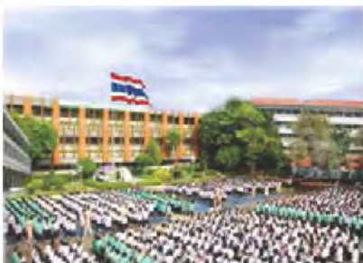
สถานศึกษา