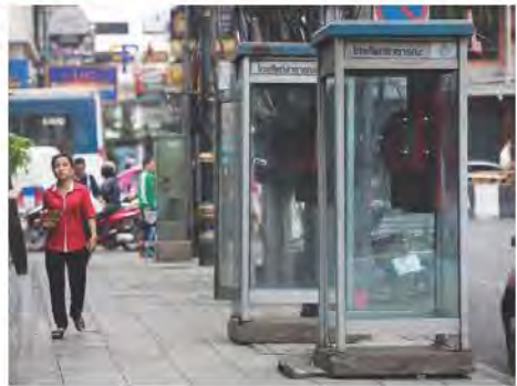
ตู้โทรศัพท์สาธารณะ