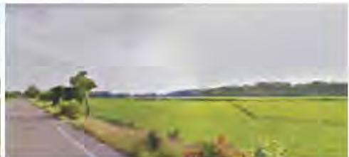
ที่ดินที่ใช้ทำกสิกรรม