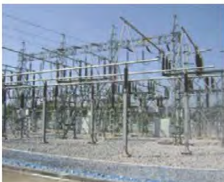
สถานโกไฟฟ้า