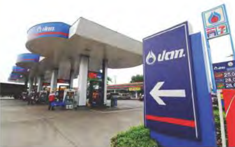
สถานีบริการน้ำมัน