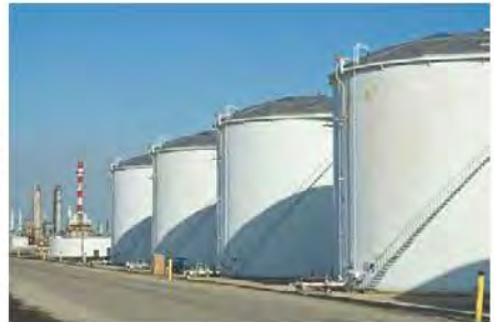
ถังเก็บน้ำมันบนดิน