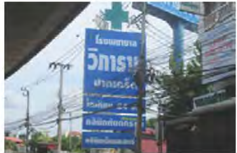
ตัวอย่างป้ายที่ต้องเสียภาษี

หากในกรณีที่ไม่มีผู้ขายแบบแสดงรายการภาษีป้าย หรือเจ้าหน้าที่ไม่สามารถติดต่อหรือหาตัวเจ้าของป้ายได้ ให้ถือว่าผู้ครอบครองป้ายมีหน้าที่เสียภาษีป้าย แต่ถ้าหาตัวผู้ครอบครองป้ายไม่ได้ เจ้าของหรือผู้ครอบครองที่ดินที่ติดตั้งป้ายจะต้องเป็นผู้เสียภาษีป้ายแทน ตามลำดับที่กล่าวมา